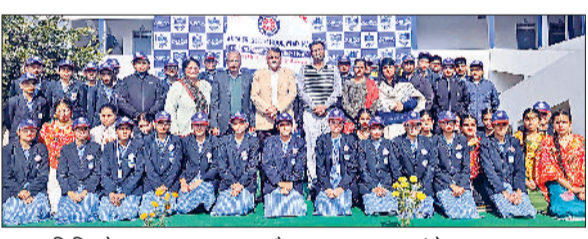
महम। शिविर के समापन अवसर पर मौजूद एनएसएस स्वयंसेवक।