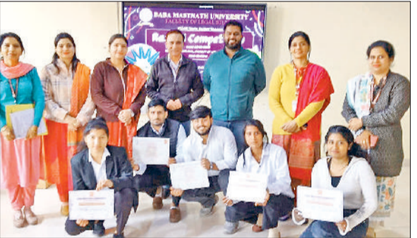
बाबा मस्तनाथ यूनिवर्सिटी में विजेताओं को सम्मानित करते शिक्षक।