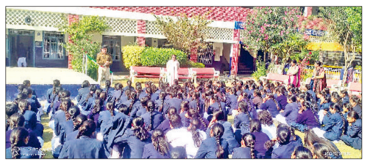
रोहतक। छात्रों को साइबर अपराध के बढ़ते तरीकों और बचाव की जानकारी देते पुलिस अधिकारी।