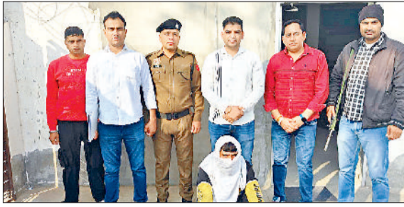
रोहतक। ऑपरेशन हॉटस्पॉट डोमिनेशन अभियान के तहत पकड़ा आरोपी।